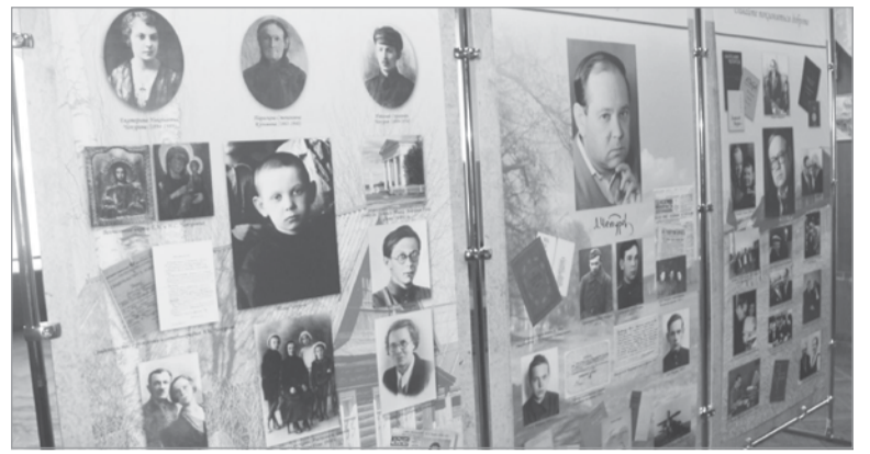
Фотовыставка, посвящённая поэту