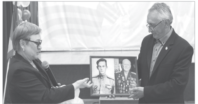
Подарок от ветерана школьному музею передала его дочь