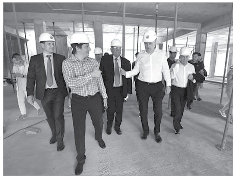
«Практически мы строим для детей дворец искусств»