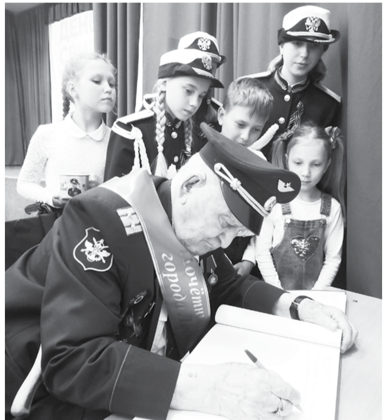
«Такую школу встречаю впервые»