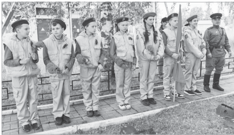
Юнармейцы городской школы № 1

Пётр ВАСИЛЬЕВ