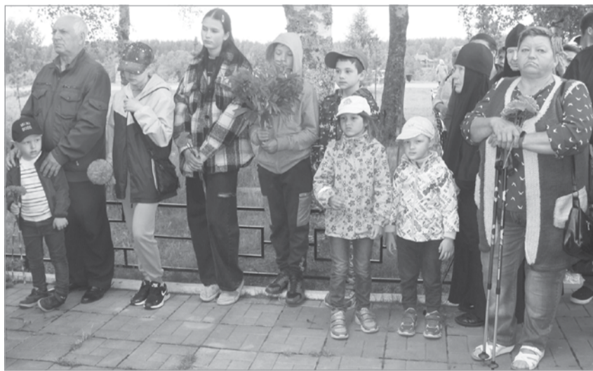
Цветы погибшим героям – от благодарных потомков