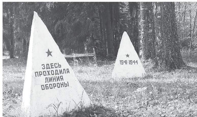
Музей под открытым небом