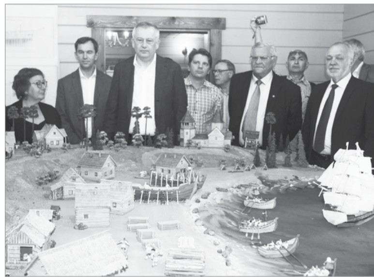
«Родина российского флота именно здесь!»