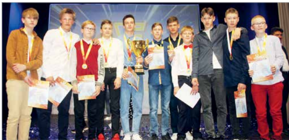
Для ребят прошедший сезон стал победным