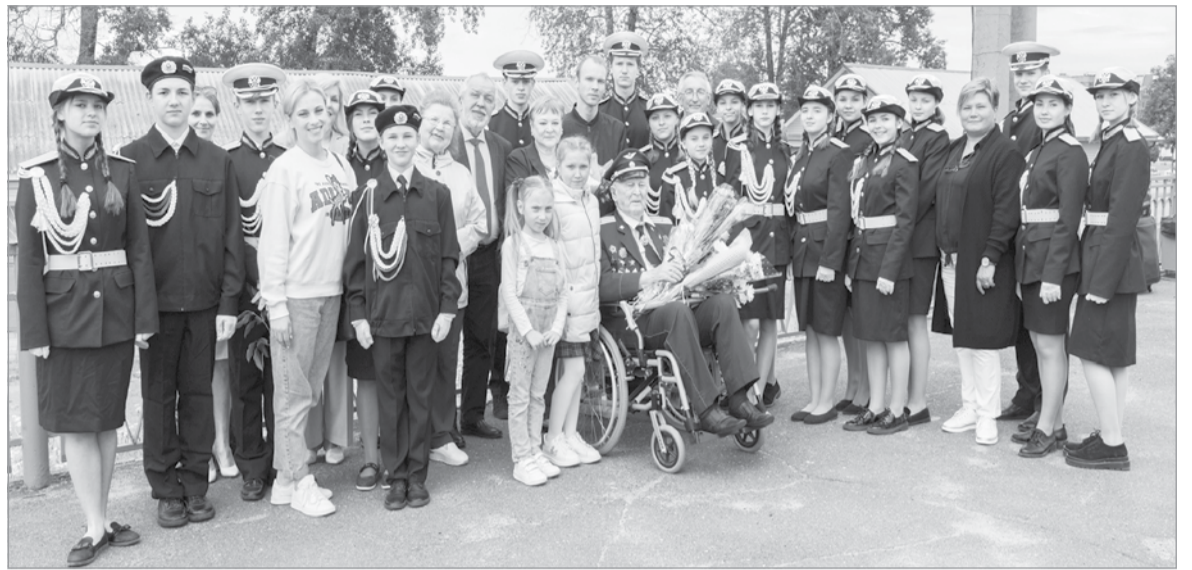
Ветерана торжественно встретили на вокзале

Весть о победе встретил в госпитале в Будапеште. После по-