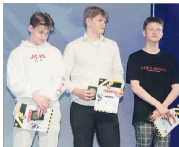
Выпускники клуба «Форвард»