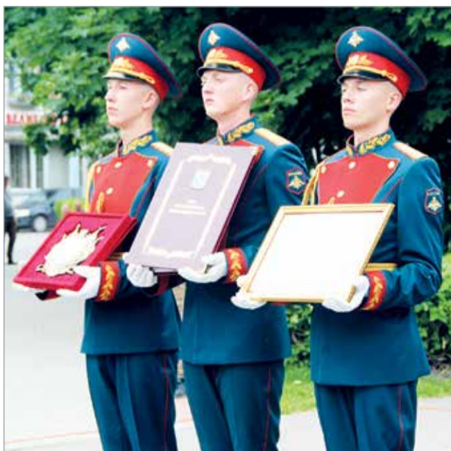
Военнослужащие роты почетного караула