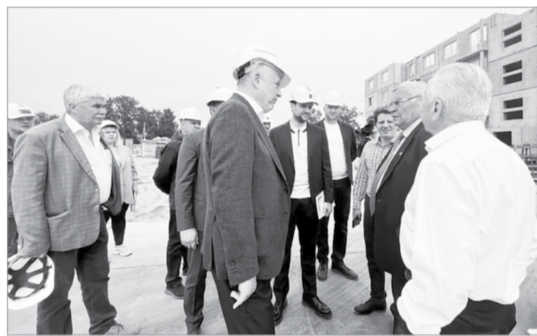
В новом доме получат жильё 137 семей